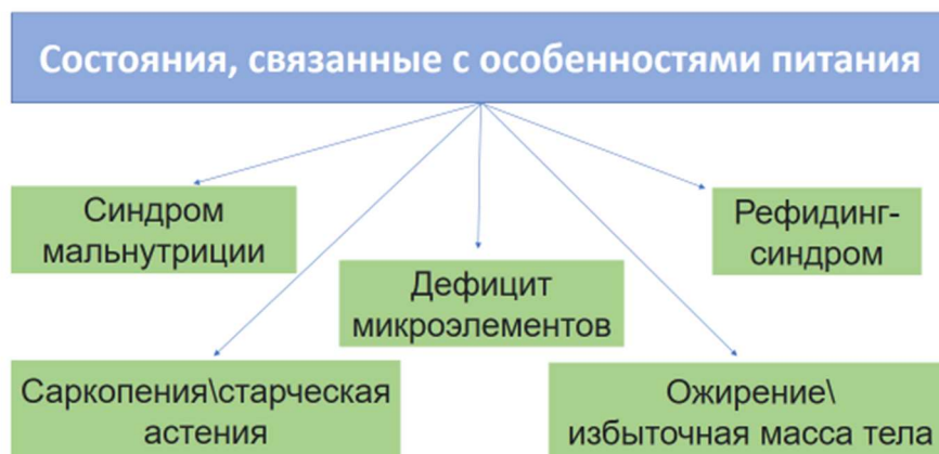
Рис. 1 Состояния, связанные с особенностями питания [2].

Недостаточность питания является полиэтиологичным патологическим состоянием, основными причинами развития которого являются следующие факторы [1-4]: