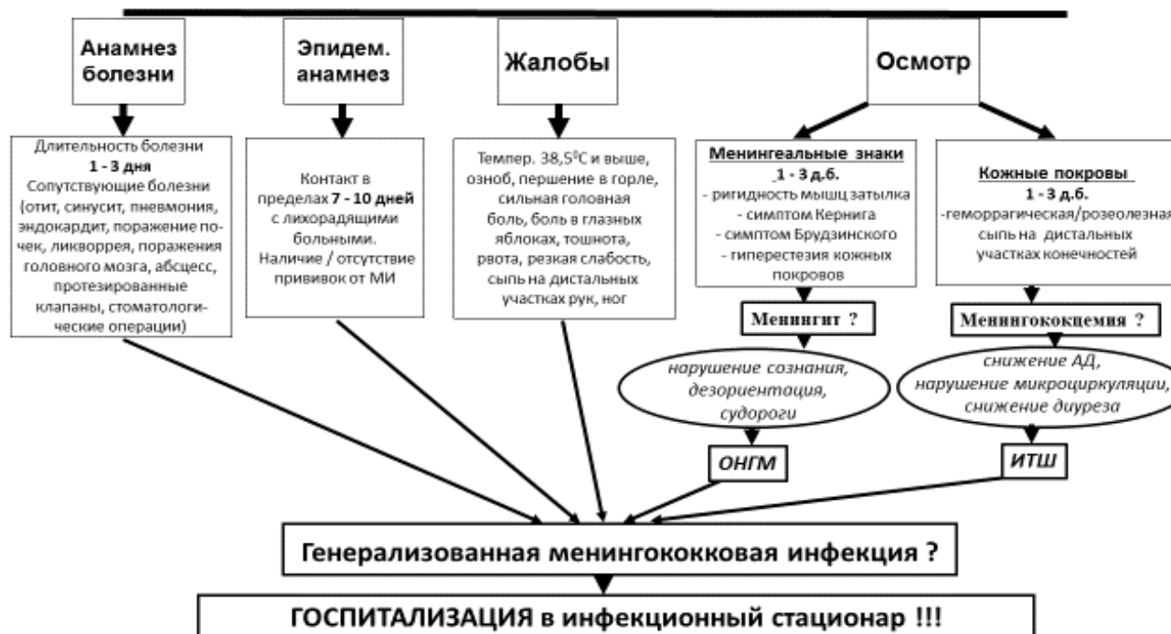
Схема 2. Суммарный схематический алгоритм ведения пациента с подозрением на генерализованную форму менингококковой инфекции (стационар).