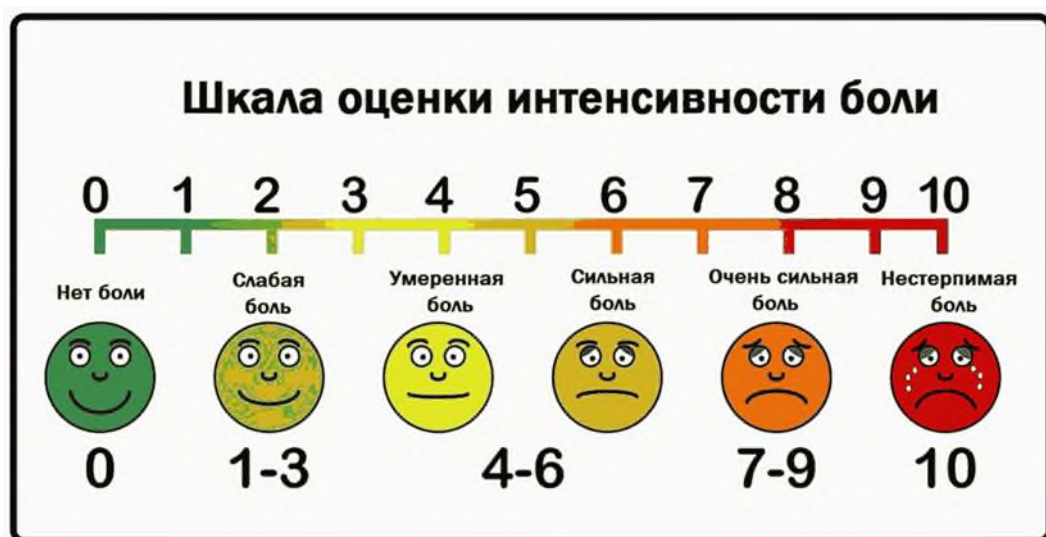
Рисунок Г.1 Визуальная аналоговая шкала (ВАШ), числовая рейтинговая шкала (ЧРШ), вербальная ранговая шкала (ВРШ)

Ключ (интерпретация): Если длина шкалы составляет 10 см, то