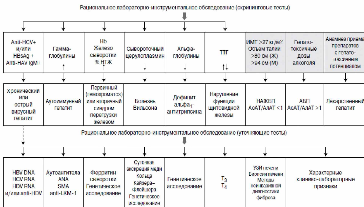
Рисунок 2. Дифференциальный диагноз алкогольной болезни печени

Особую сложность в ведении пациентов с АБП представляет дифференциальный диагноз измененного сознания. Спутанность сознания может возникать не только по причине гипераммониемии (печеночная энцефалопатия), но и в результате нейротоксического действия алкоголя, при развитии энцефалопатии Вернике, корсаковском психозе, синдроме отмены. На стадии ЦП причинами измененного сознания могут быть внепеченочные состояния, которые вызывают или усугубляют симптомы ПЭ — так называемые провоцирующие факторы [90]. К ним относятся хорошо известные факторы: инфекции (пневмония, мочевиная инфекция, спонтанный бактериальный перитонит, сепсис, острый гастроэнтерит и другие), желудочнокишечные кровотечения, запор, избыточное расщепление глутамин глутаминазами тонкой кишки, дегидратация, гипонатриемия, гипокалиемия, неконтролируемое использование диуретиков, прием бензодиазепинов, избыточное употребление белка и факторы, роль которых в развитии ПЭ активно обсуждается в последние годы: потеря скелетной мышечной массы (саркопения) и наложение трансъюгулярного внутрипеченочного портосистемного шунта. Мероприятия, направленные на устранение/коррекцию этих факторов, в комбинации с гипоаммониемической терапией сопровождаются клиническим улучшением ПЭ.