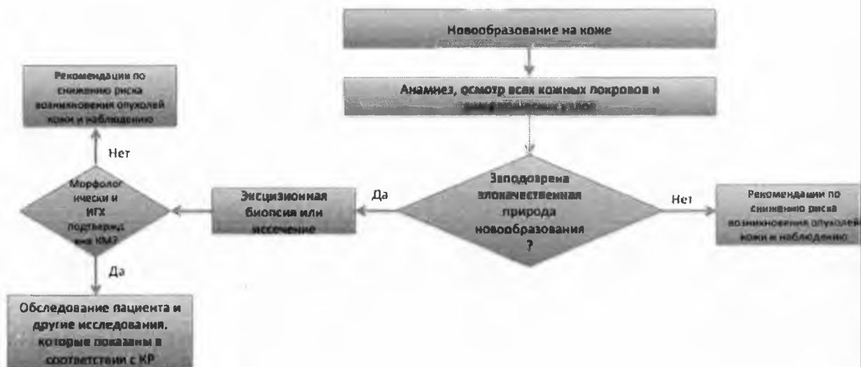
Блок-схема 1. Диагностика и лечение пациента с подозрением на опухоль кожи (КМ)