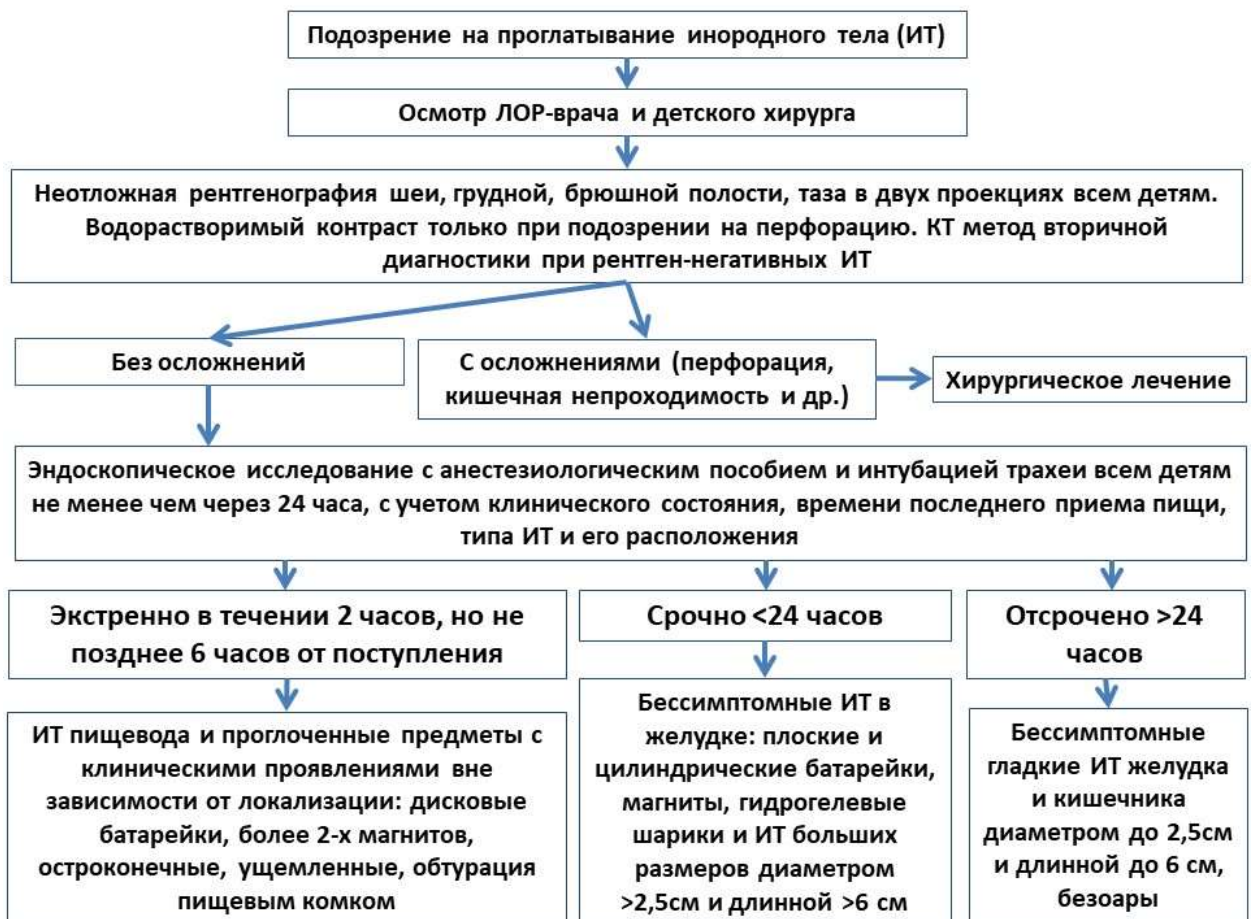
Рис. 2. Алгоритм действий при проглатывании инородных тел у детей.