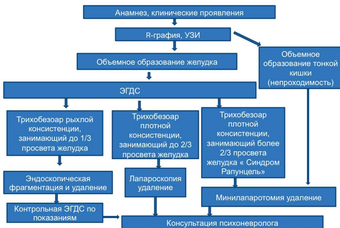
Рис. 6. Лечебно -диагностический алгоритм при инородных телах ЖКТ с комбинированным воздействием.