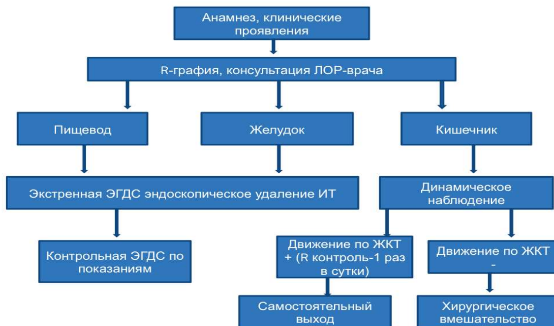
Рис. 5. Лечебно -диагностический алгоритм при механически активных инородных телах ЖКТ.