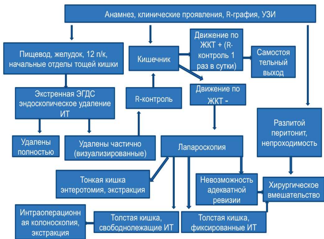
Рис. 4. Лечебно -диагностический алгоритм при химически активных инородных телах ЖКТ.