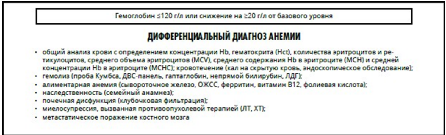
Схема 1. Рекомендуемый алгоритм обследования пациента с анемией при злокачественном новообразовании.