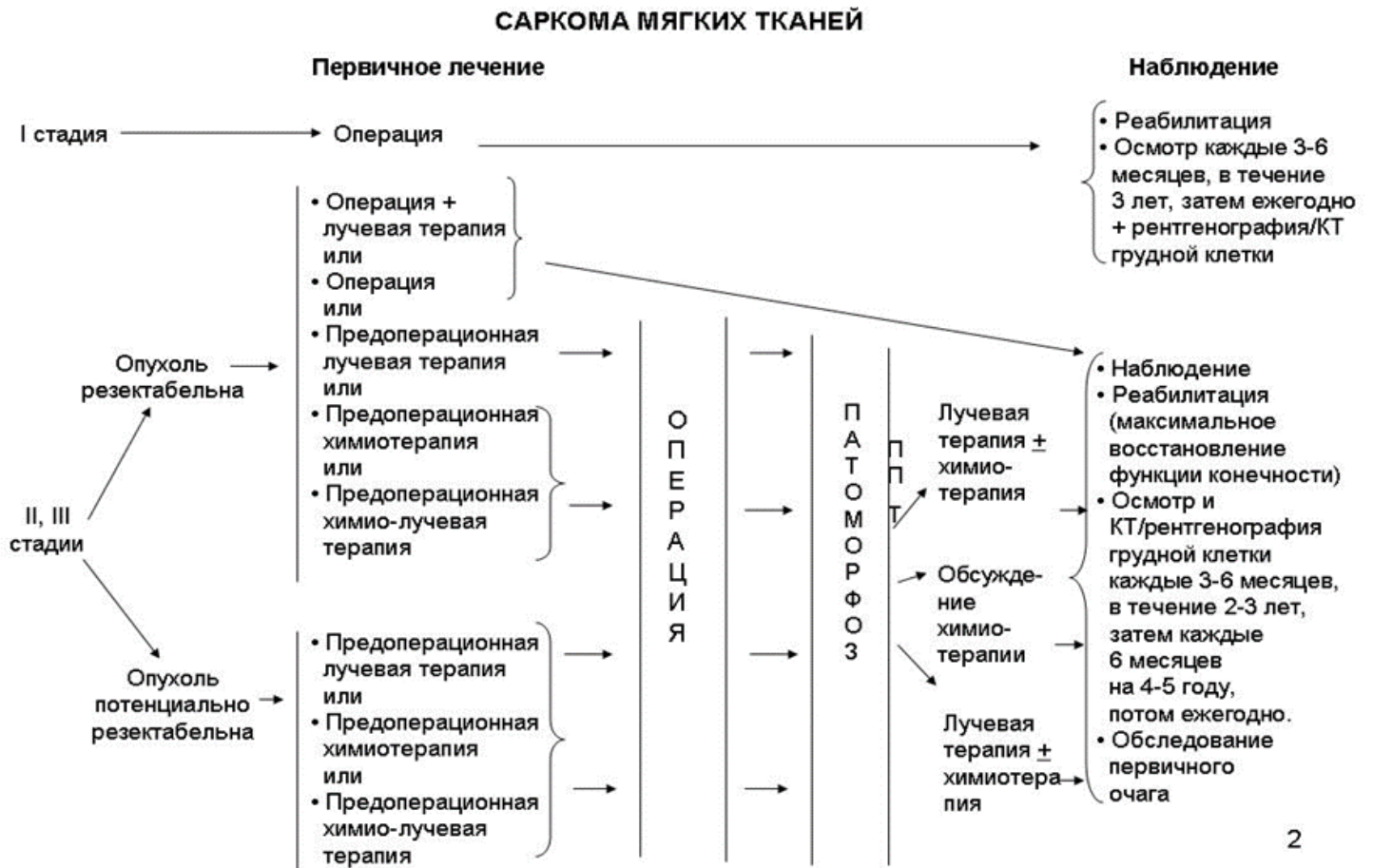
Схема 1. Блок-схема диагностики и лечения пациентов с саркомами мягких тканей