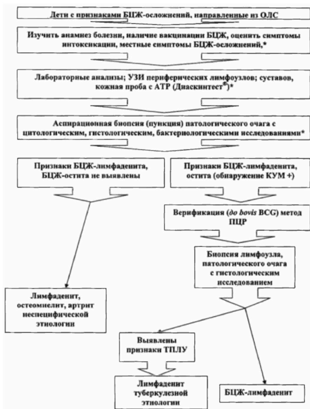
Схема 2. Алгоритм дифференциальной диагностики БЦЖ-осложнений у детей в условиях туберкулезного учреждения