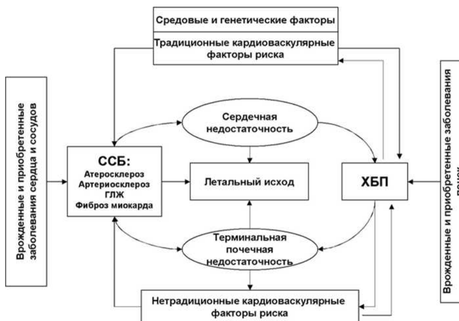
Рисунок 1. Схема кардиоренального континуума [35]

Примечание. ССБ - сердечно-сосудистая болезнь.