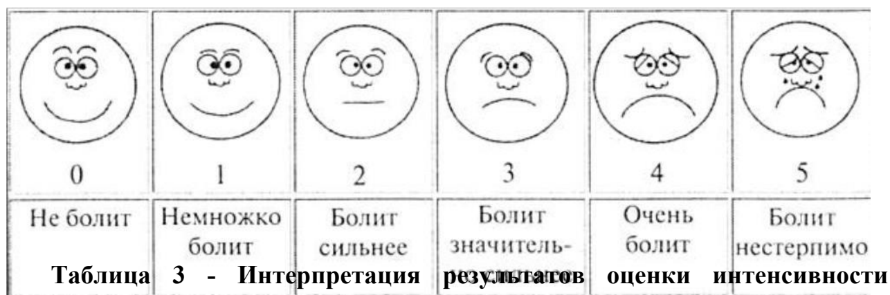
Рисунок 1 - Рейтинговая шкала оценки боли по выражению лица Вонга-Бейкера для детей старше 3 лет (D. Wong, C. Baker, 1988)