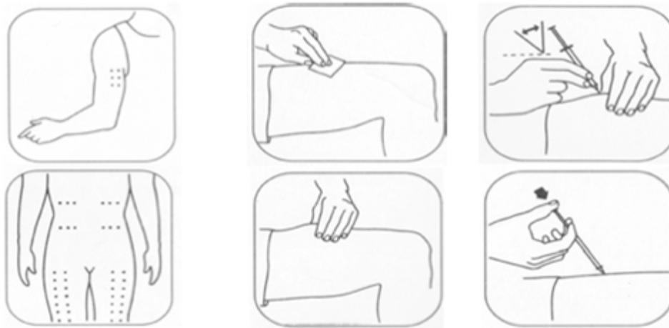
Рисунок 1. Места инъекций и правила введения рчГ-КСФ

Как только подобрана доза рчГ-КСФ пациенты могут вести нормальный образ жизни, в том числе посещать детские учреждения, заниматься активно спортом.