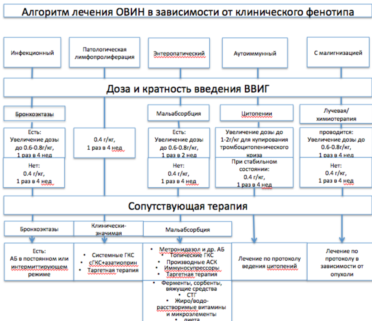
Рис 4. Алгоритм лечения ОВИН в зависимости от клинического фенотипа.